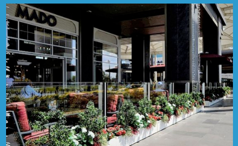
Unten in Parkstellung

Wahlweise erhalten Sie die Module mit Handlauf, oder mit Blumenkästen, welche Sie selber mit Zierpflanzen ausschmücken können.