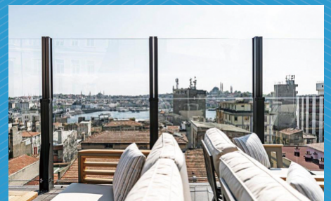
Nach oben ausgefahren

Die Gläser können auch wahlweise blickdicht ausgeführt werden, oder beliebig mit wetterfestem Logo bedruckt werden. Gerne beraten wir Sie!